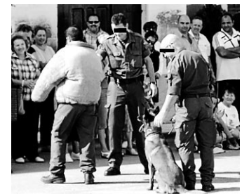
►► Un momento de la jornada.

► EL SERVICIO cinológico de la Guardia Civil ha realizado esta semana una exhibición de perros adiestrados en el municipio zaragozano de Piedratajada. En ella los vecinos conocieron cómo se realiza la búsqueda y detección de explosivos y drogas. La jornada fue muy valorada tanto por los asistentes como por los propios efectivos. E. P.